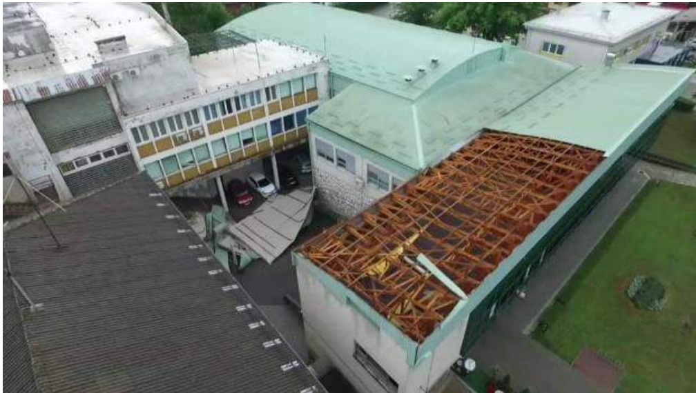
Slika 2. Nevrijeme 03. kolovoza 2020. godine