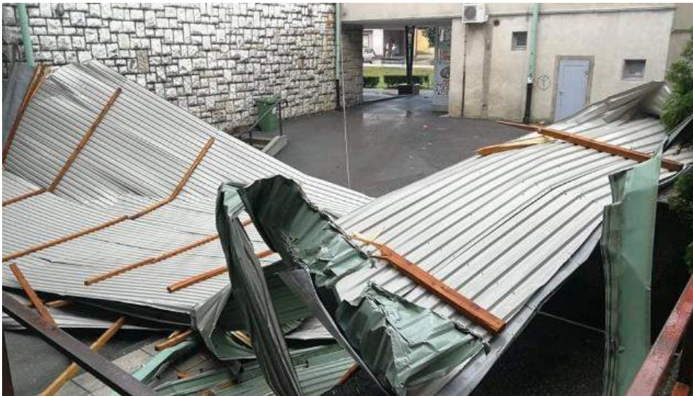
Slika 1. Nevrijeme 03. kolovoza 2020.godine