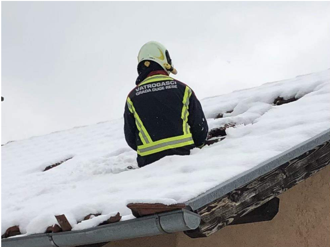
Slika 3. Sanacija krovišta nakon potresa (Glina)