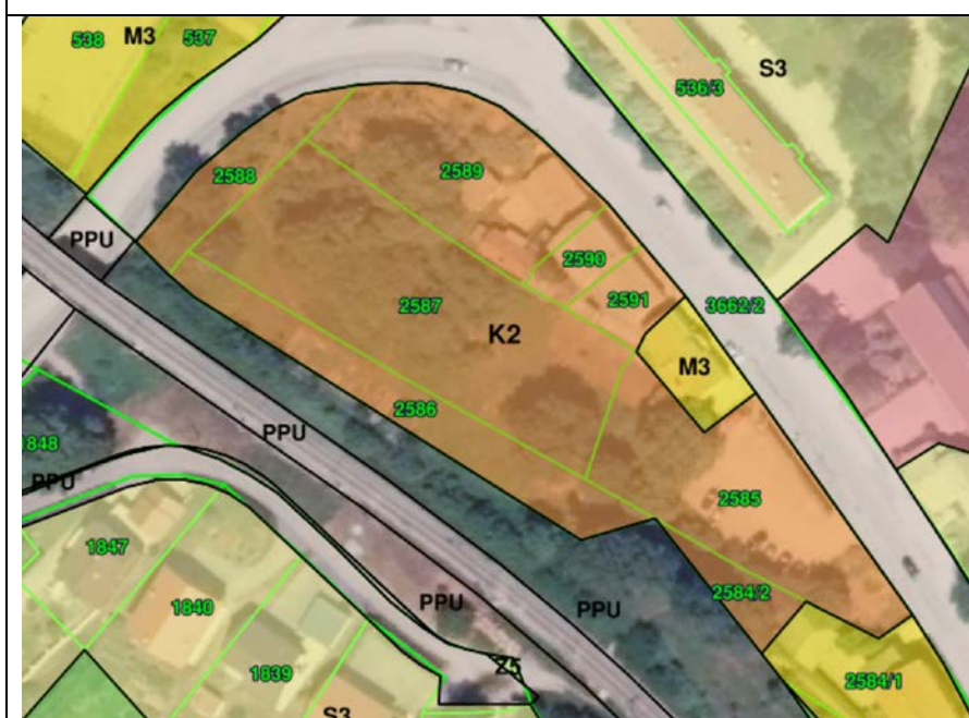
IV. Izmjena i dopuna Plana