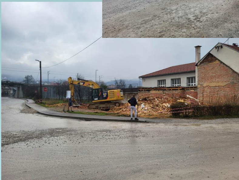
15.12.2022. Uklanjanje građevine