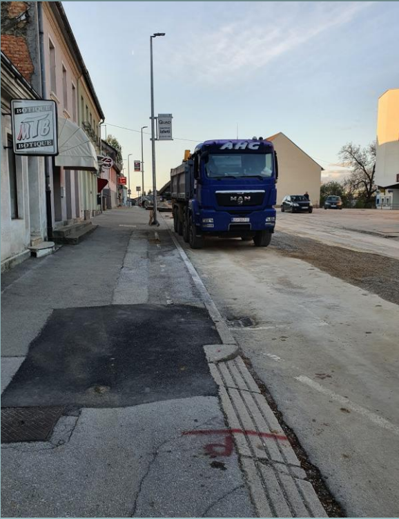
25.04..2022. Prije radova