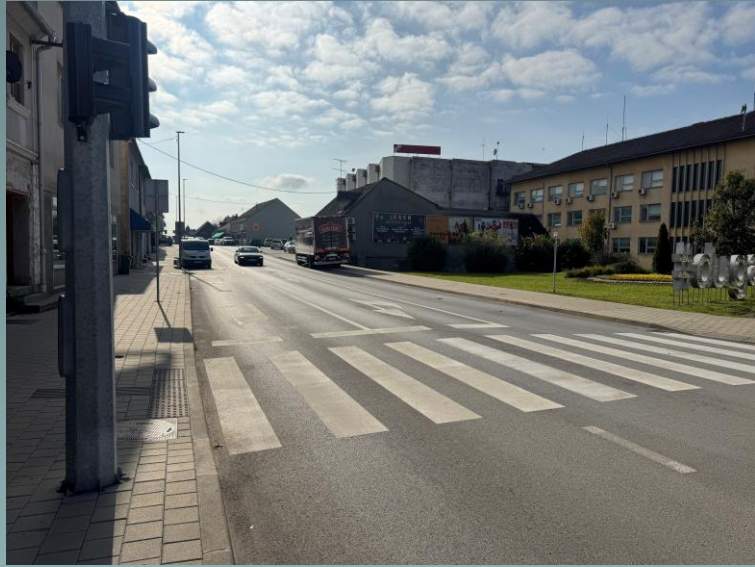
14.10..2025. Nakon radova