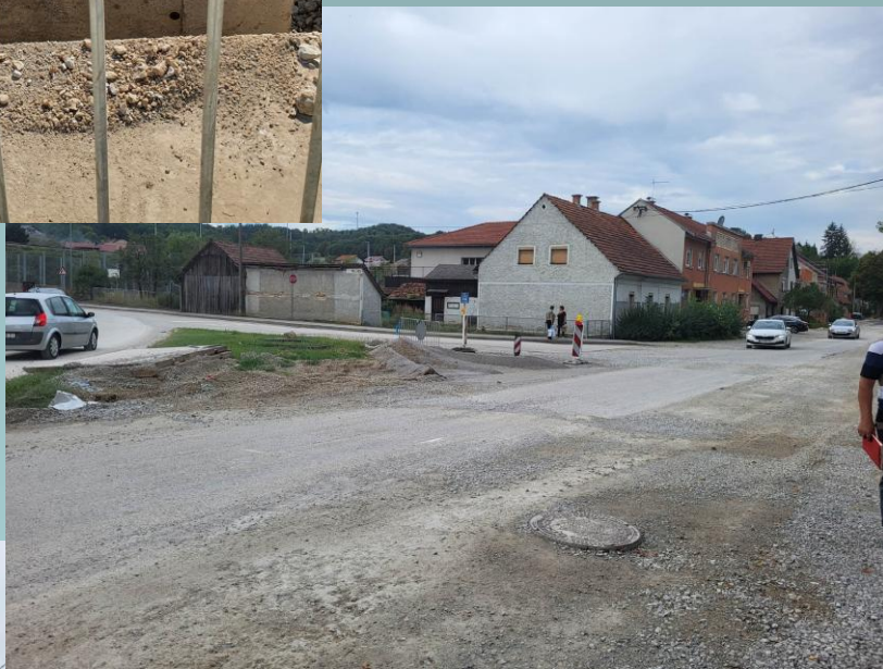
22.08.2022. Stanje prije radova