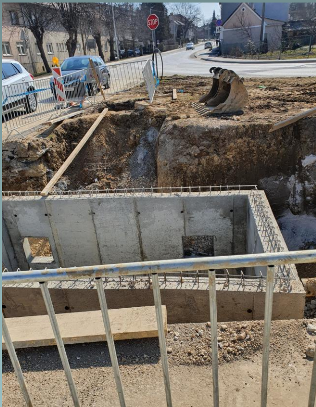
11.03.2022. Prethodni radovi na odvodnji