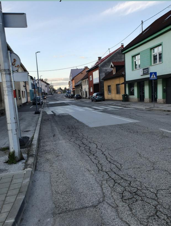
25.04.2022. prije radova